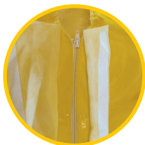
双层不干胶粘合拉链